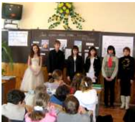
На фотографіях - учні НВК № 23