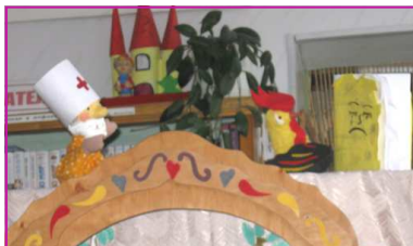
Актори лялькового театру бібліотеки НВК № 7 (5-Б клас) і вдячні глядачі (учні 1-2 класів)