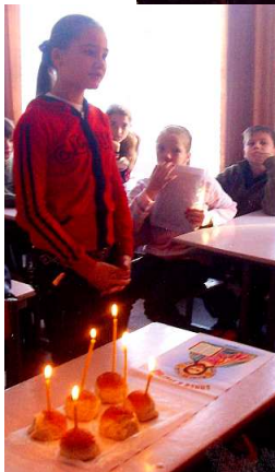
Фотографія заходу, присвяченому пам'яті жертв Голодомору