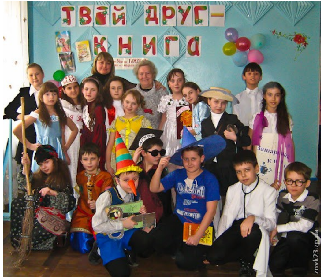
Шкільні будні та свята, конкурси та змагання, перемоги та досягнення учнів шкіл Комунарського району - в Альманаху шкільного життя «Платформа».