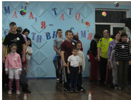
Фотографії зі свята в ЗНВК № 23