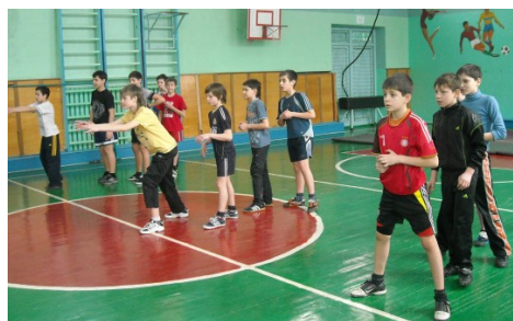
Фоторепортаж праздника ко Дню защитника Отечества в ЗУВК № 23