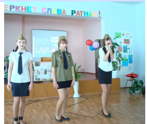
Фото з Фестивалю солдатської пісні в ЗОШ № 17