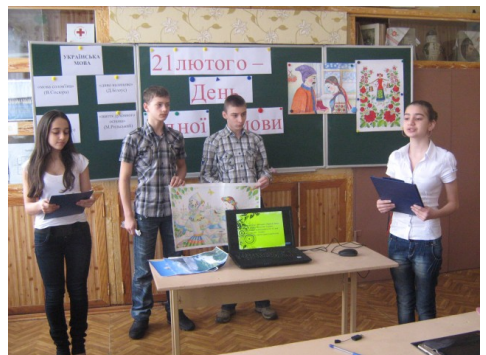
Фоторепортаж із заходу-проекту “Рідна мова – найдорожчий скарб” НВКТП