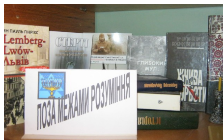
Фоторепортаж з виставки в ЗОШ № 83