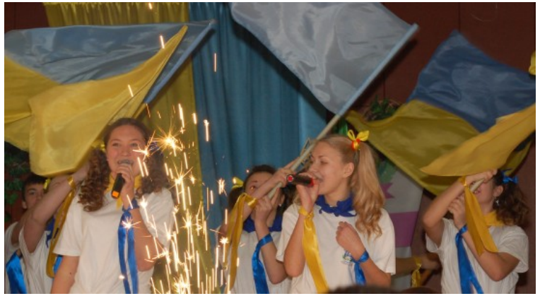
На фотографии - команда КВН «88 Чудо света» НВК № 88