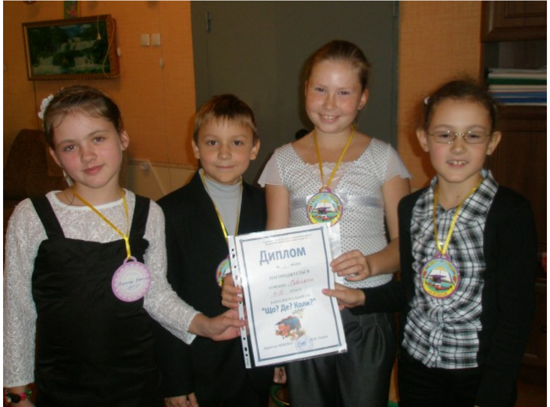
Победители интеллектуальных игр в начальных классах ЗУВК № 23. Полуфинал интеллектуальных игр на кубок Коммунарского района для учащихся 7-11 классов (24 команды) состоится на базе ЗУВК № 23 09.12.2011г.