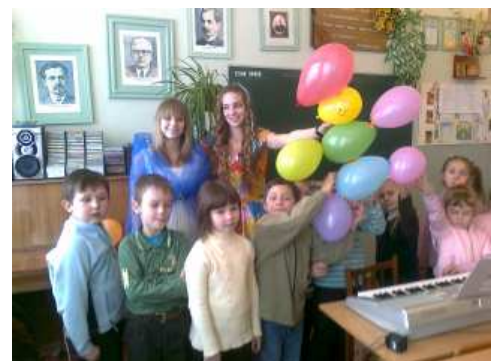
На фото - організатори й учасники шкільного свята Масляна - учні навчально-виховного комплексу технічного профілю