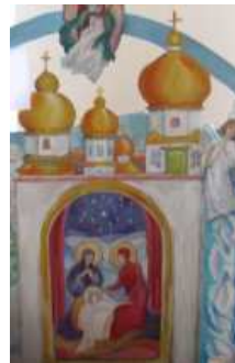
На фотографіях - роботи учнів НВК № 23, 103, ЗОШ № 90, НВК № 88, ЗОШ № 80, гімназії № 107, ЗОШ № 38