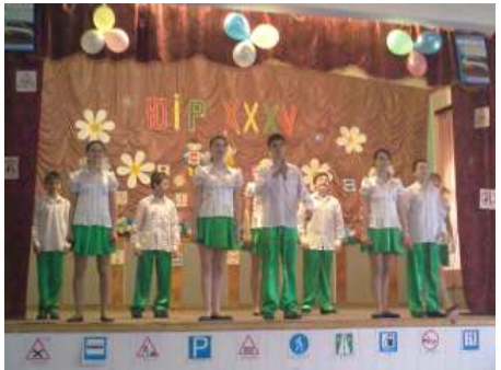
На фото - загони ЮІР НВК № 88 «Сигнал», НВК № 110 «СТО»