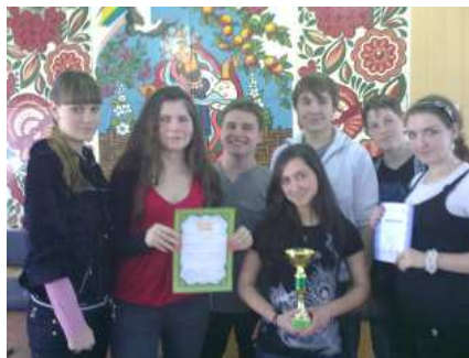
На фотографіях - команда НВК № 23 «Лови нашу волну», команда НВК № 7 «Медведь не енот», команди-призери НВК № 23