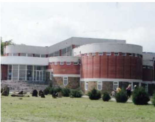
Фотографії к статті «Мой край родной»