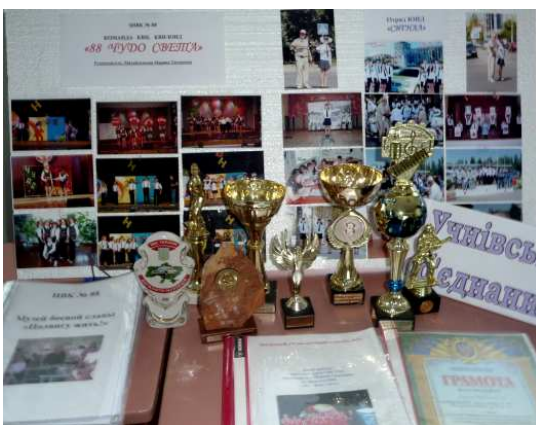
Фоторепортаж журналистов школ № 7, 23, 90